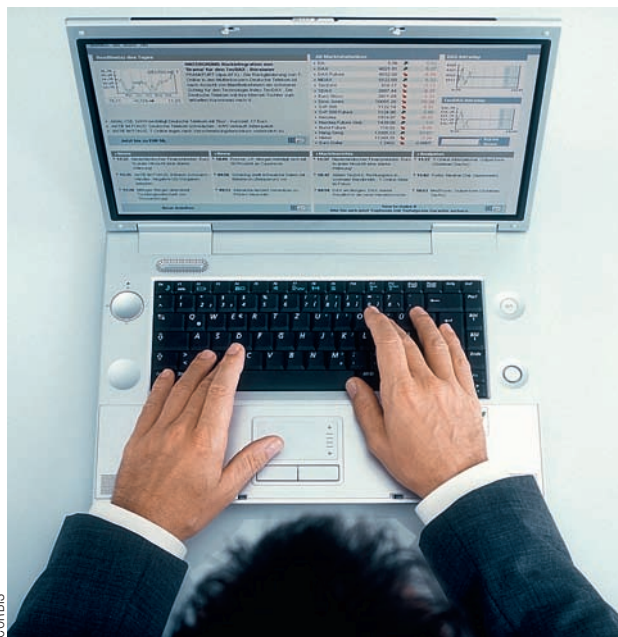
Nicht immer einfach: Hypothekar-Offerten online einholen

Bei drei Anbietern lassen sich Offerten für Hypotheken per Internet einholen. Eine Stichprobe von K-Geld zeigt: Bei Comparis ist das relativ teuer.