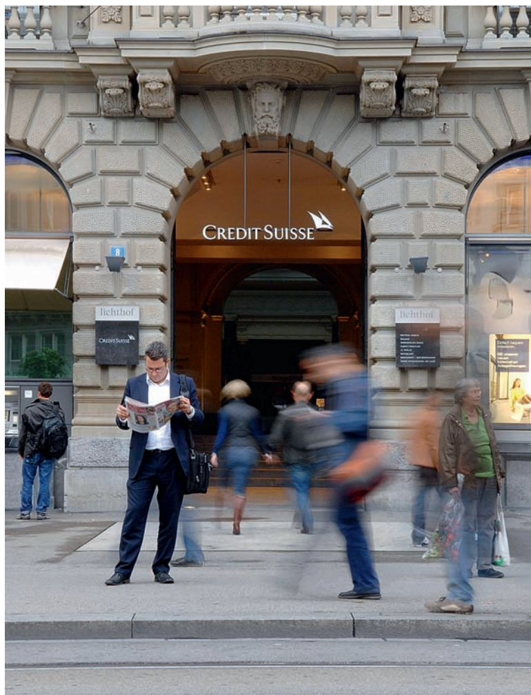
Credit Suisse: «Die Verkaufsgebühr deckt die Bearbeitungskosten der Bank»

► Fondsverkauf. Wenn ein Anleger Anteile eines aktiv gemanagten Fonds kauft, muss er der Bank nebst dem Preis für die Fondsanteile meist bis zu 5 Prozent Ausgabe-kommission zahlen. Rücknahmegebühren beim Verkauf von Fondsanteilen waren bisher die Ausnahme. Nun führt die CS per 1. Juli bei einem Verkauf Bearbeitungsgebühren ein. Wer z.B. Fonds im Wert von 50 000 Franken verkauft, zahlt für die Rücknahme 300 Franken (0,6 Prozent). Die Mindestgebühr beträgt 50 Franken. Zum Vergleich: Weder die UBS noch Postfinance, Raiffeisen, Migros-Bank oder die Internet-Börsenhändler Swissquote und Strateo verlangen beim Verkauf Rücknahmegebühren.